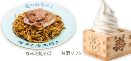
なみえ焼そば 甘酒ソフト

復興の途中にある浪江町にとって道の駅は、町の復興のシンボルとしての使命を持って誕生しました。買い物ができ、食事ができ、ちょっと休憩もできる、町の人々の暮らしを支える場所、そして、町の人たちの新たなチャレンジを支える場所。浪江町は新しい町へと彩りを変えていきます。