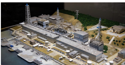
事故直後の福島第一原発の精巧なジオラマ