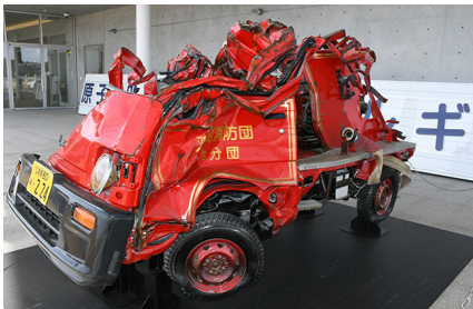
原型をとどめていない消防車